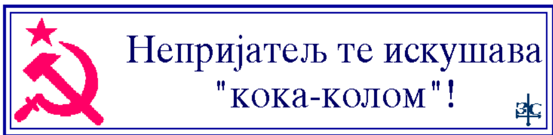
Слика: Плакат на зиду изнад шубера *

Када сам био мали, за Београд се путовало возом. Увек би преседали у Лапову. Воз смо, као и сви путници, чекали у загушљивом ресторану железничке станице. Ја бих, док би се родитељи забављали картама, натезао кабезу из флашице са белим порцеланским затварачем. Тада бих обавезно буљио у плакат на зиду изнад шубера и питао се је ли "кока-кола" боља.