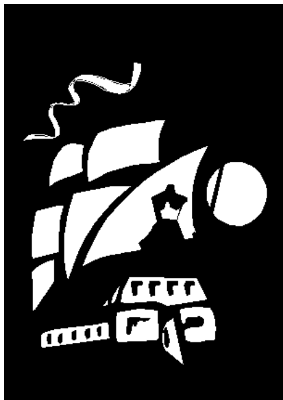
Слика 4: Деда . Једрењак на месечини. Уље на платну, 50 x 70 cm.