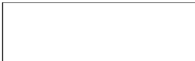
Слика: Вођа . Шара за тоалет папир. Туш на хамперу, 20 x 10 cm.

Зашто је тоалет папир увек једнобојан? – на једном се огласи Вођа. Окружен сам уметничким делима, све је исликано до најмање ситнице – само је тоалет папир празан. Док губим време на ноћној посуди, хоћу да држим у рукама папир који ће да ми покреће мисли, јер вођа мора увек да размишља. Сва је срећа да сам и сликар па сам нацртао себи шару. Ево, узмите цртеж, и да буде одштампан до сутра!