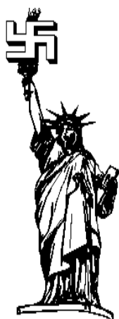
Слика 3: Деда . Кип слободе. Дрво, висина 20 cm.

ви, "имате довољно времена да размишљате о том недостатку." Од тог тренутка деди је стално тај кип пред очима. Једне ноћи уснио га је друкчијег: потпуног. Тек тада је спознао разлику. Уплашио се да ће до јутра да заборави: брзо се пробудио и сан претворио у нови мали кип. "Ви нисте само талентовани већ и паметни. Дозволићу Вам да задржите скулптуру као успомену на наше познанство", казао му је командант. Од тада више нико није видео кип: деда га држи под кључем у свом ноћном ормарићу. Свако вече пред спавање откључава га – милујући његову површину, шапуће: "Умрећеш пре мене, мали говнару."