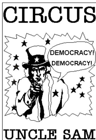
Слика 1: Плакат пред циркусом који посматра деда.

Дан је прешао половину и деда ме води у циркус. Посматрамо плакат постављен пред улазом. Хватам деду за руку, а он ми, не скидајући поглед с плаката, каже: "Људи воле клонове. Кловн не сме да умре. Никада."