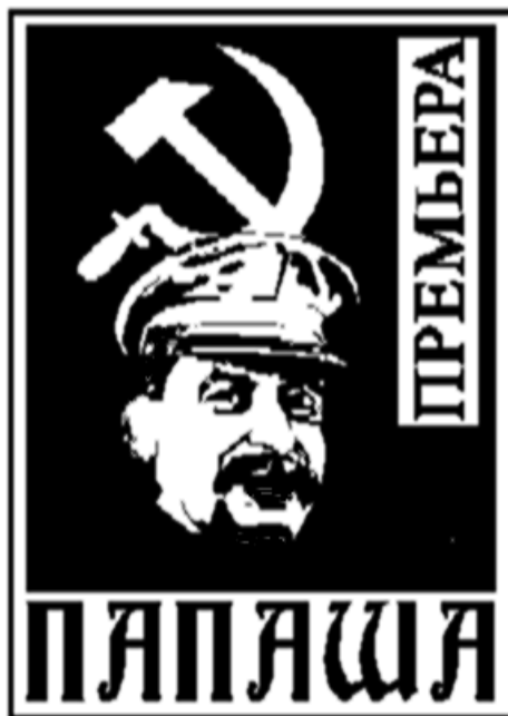
Слика 2: Плакат пред позориштем који посматра деда.

Пролазимо поред позоришта: деда посматра плакат пред улазом. Провлачим му се између ногу, а он ми, не скидајући поглед с плаката, говори: "Људи воле позориште. Позориште не сме да умре. Никада."